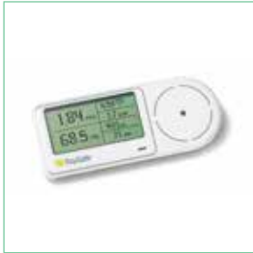
RAYSAFE THINKX INTRA